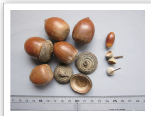
*大きなオキナワウラジロガシ(左)と小さなコナラ(右)↑

他にもウバメガシのどんぐりは海岸沿にしか生えていませんし、世界でも最大級といわれるオキナワウラジロガシのどんぐりは大隅半島(鹿児島県)の先端が北限ですが、実際には西表島(沖縄県)まで行かないと、なかなか手に入りません。