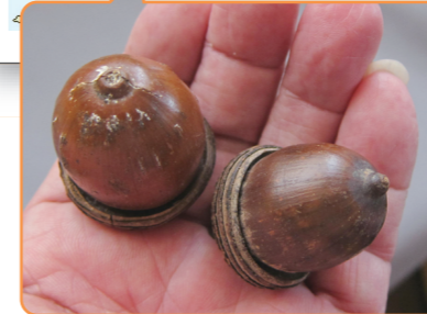
↑オキナワウラジロガシ