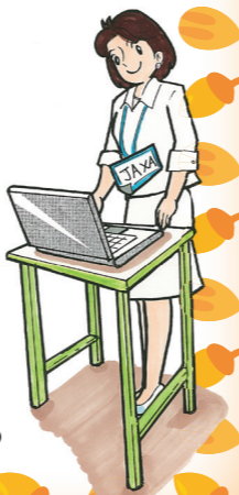
←JAXA宇宙教育センターホームページへ投稿しよう