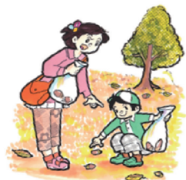
↑どんぐり拾いでかけよう

あなたの住む地域のどんぐりを、写真に撮ったり、スケッチして見せ合ったり、また実物を送るなどして、全国の皆さんで協力し合えば、どんぐりについていろいろなことがわかると共に、あなたの世界はもっと広がることでしょう。