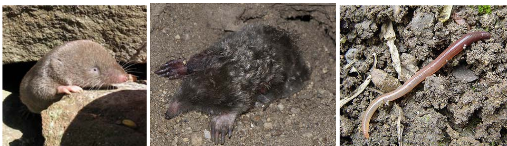
左)トガリネズミ :Blarina brevicauda 中)モグラ :Mole in hole. 右)ミミズ :Earthworm

さらに小型のミミズ、クモ、トビムシ、ダニ、昆虫の幼虫、線虫などの無脊椎動物が植物の遺体を細かく粉砕したり、土を耕したり、特定の病害虫被害の急激に発生するのを防いだりしています。以下は仮定の話ですが、もしもこれらの動物、生物が土中に棲んでいなかったら、たとえば森林では毎年地面に積もる落ち葉がそのまま分解されずに残って行き、その結果植物遺体などから分解、生成されていた無機成分の植物にとっての栄養の供給も止まり、すなわち植物がそれ以降育つことができなくなるでしょう。植物が育たなくなれば、それを餌とする動物も生きていけなくなります。すなわち、地球の生き物が次の世代も生きていけるように物質を循環させる輪の中にこれら生物の存在は欠かせません。植物が単純な化合物から太陽の光エネルギーを使って複雑な有機化合物を作り、その一部を動物が利用し、さらに作られた複雑な有機物を植物が栄養として利用できる単純な無機物へと分解する過程を担っている、それがこれら土中の生物たちなのです。